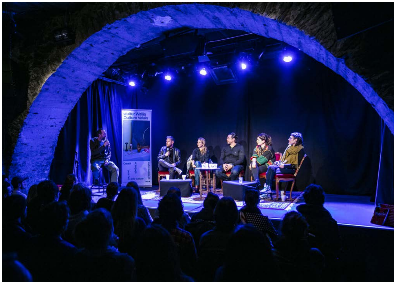
Le Forum Musical 2019 aux Caves du Manoir à Martigny a fait salle comble

Notre bureau de conseil et d'information est entièrement dévoué aux acteurs culturels. Notre mission : renseigner, faciliter les contacts, transmettre des informations et organiser des formations continues. De plus en plus d'entreprises s'adressent à nous lorsqu'elles recherchent des artistes pour animer leurs événements. Nous avons de quoi les satisfaire! Les ateliers, cours et séances d'information organisés par Culture Valais rencontrent un grand succès ; leur taux de fréquentation est excellent et ils sont très appréciés. En plus de permettre l'échange d'informations, ils sont devenus des rendez-vous importants de la scène culturelle valaisanne et nombre de projets multisectoriels y ont vu le jour.