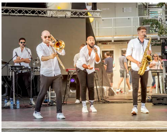
Le groupe Klischée en ouverture de la journée valaisanne de la Fête des vigneronns 2019.

visiteurs lors de la journée valaisanne de la Fête des vigneronns 2019