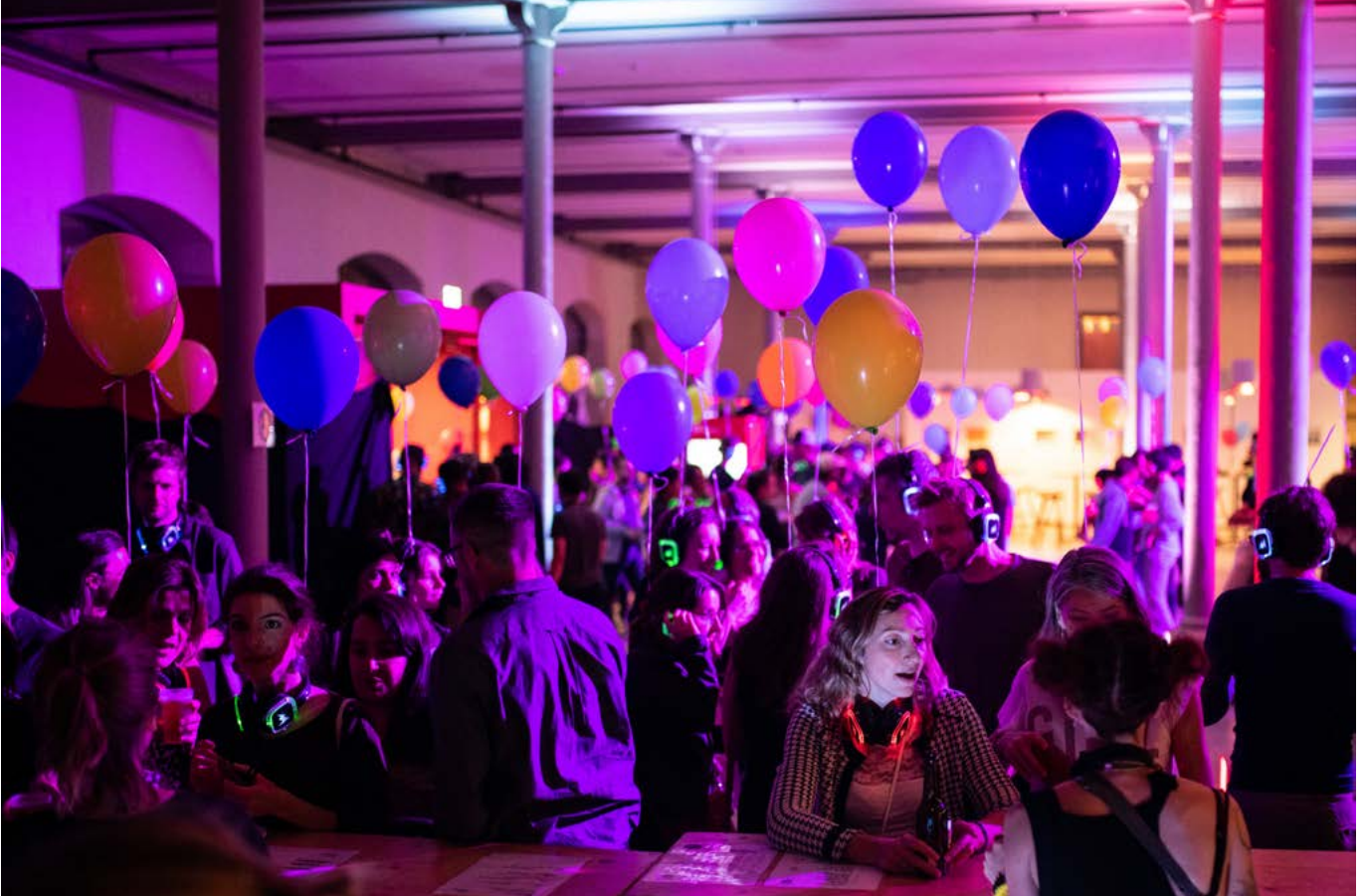
La 1ère Balloon Silent Disco au centre culturel Les Arsenaux à Sion, le 13 septembre 2019.

L'union fait la force. Culture Valais a depuis longtemps fait sienne cette sagesse proverbiale. C'est pour cette raison que nous ne réalisons jamais nos projets seuls, mais cherchons toujours les partenaires adéquats. Des collaborations fructueuses ont ainsi vu le jour. L'an dernier, nous avons développé et entretenu des partenariats avec des acteurs issus des domaines de l'économie, en particulier du tourisme, des médias et de la culture. Ils ont rendu possible des actions que nous n'aurions pas pu mener seuls. Nous remercions nos partenaires pour ce bel esprit de collaboration et espérons concrétiser d'autres projets à l'avenir. Unir nos forces pour atteindre des objectifs communs : telle est plus que jamais notre devise !