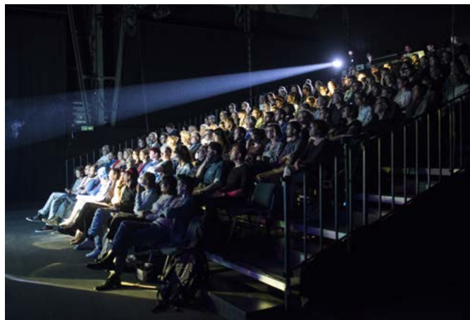
Le TLH-Sierre fut le centre théâtral de la Rencontre du théâtre suisse 2019.

pièces de théâtre présentées durant les 5 jours de la manifestation