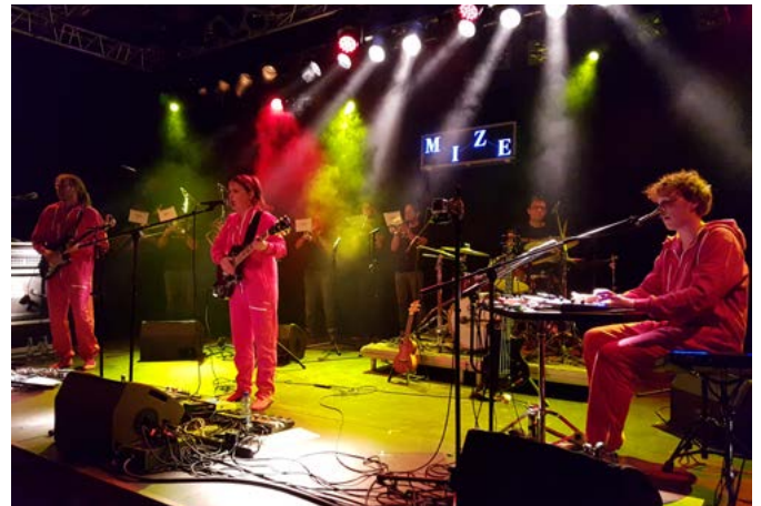
MIZE, en concert au Port Franc (Sion) et participante aux permanences de la FCMA.

artistes ont participé aux deux permanences de la FCMA durant la saison 2018/19