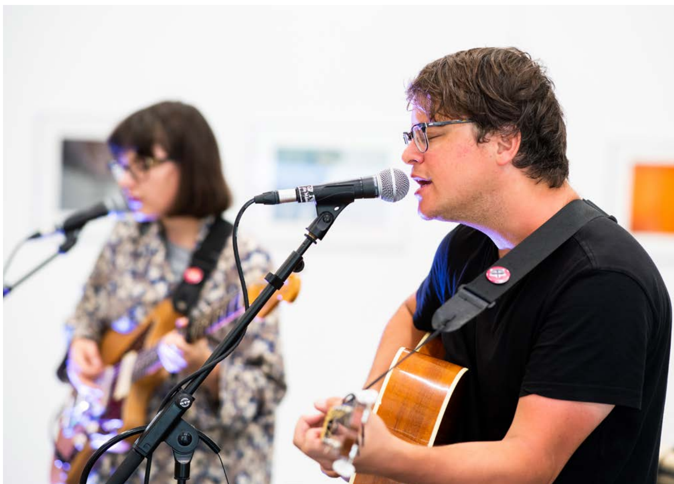
Yellow Teeth en concert lors des Arsenaux en Fête 2019

événements publiés en 2019 sur l'agenda culturel par plus de 709 organisations