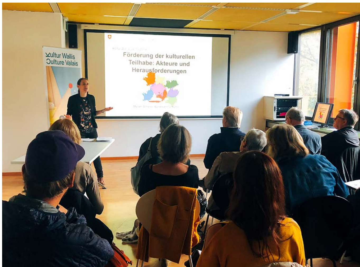
Première formation bilingue de Culture Valais, au TLH-Sierre, sur la participation culturelle.

participants aux 10 cours de l'année 2019 (taux de satisfaction : 4.5/5)