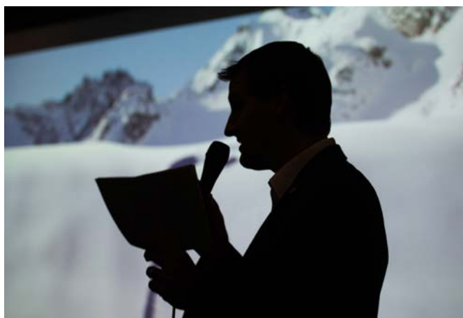
Ouverture de la table ronde « La gestion du danger d'avalanche : un savoir-faire patrimonial »

FORUM POT D'VIN animés par Culture Valais durant la saison du TLH-Sierre