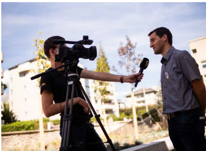
Interview de Canal9 lors de la manifestation « Les Arsenaux en Fête »

sujets médias ont concerné Culture Valais et ses activités lors de l'exercice 2018/19