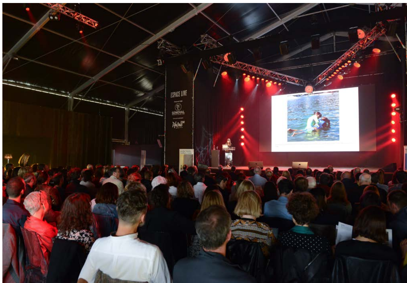
L'Espace Live de la Foire du Valais sert de caisse de résonance au Rendez-vous de la Culture.

personnes ont pris part au Rendez-vous de la Culture 2019 (nouveau record)