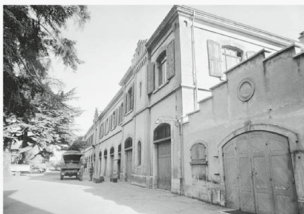
En 1985, les arsenaux étaient encore dédiés à l'armée.

C'est en 1895, il y a près de 125 ans, que l'arsenal cantonal, sis à la rue de Lausanne, entre en fonction. Le concours d'architecture n'ayant rien donné, c'est l'épreuve de Joseph de Kalbermatten, hors compétition, qui est sélectionnée. Ce premier bâtiment abrite les ateliers de l'armée et ses entrepôts de matériel: armes et habillement de l'infanterie en particulier. En 1917, l'arsenal fédéral vient compléter son pendant cantonal à quelques mètres de là, avenue Pratifiori. Une passerelle de bois reliea les deux bâtisses dans les années 30. Cinquante ans plus tard, les arsenaux, autrefois à l'extérieur de la ville, se retrouvent au cœur de la capitale. Leur déplacement aux casernes est donc annoncé et les anciens arsenaux affectés à la Bibliothèque cantonale. En 2000, le nouveau millénaire apporte avec lui l'ouverture de la médiathèque dans l'arsenal fédéral laissé vacant par l'armée. 85 000 ouvrages y seront déjà entreposés cinq ans plus tard. En 2009 enfin, un concours d'architecture est lancé pour dessiner les contours du deuxième édifice. Il prime le bureau genevois Meier et associés et les travaux débutent trois ans plus