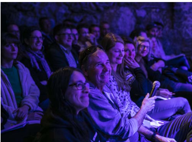
Les échanges et débats entre acteurs culturels sont le but principal du Forum musical.

participants lors du 7ème Forum Musical (édition record)