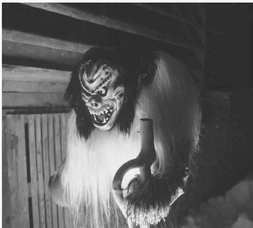
Les célèbres Tschäggättä vont constituer un élément fort du cortège de vendredi. GIOVANNI CASTELL

C'est l'abricot, le roi du verger autochtone, qui va être présent tout au long de la journée. Pas moins de 60 000 fruits vont être distribués, 20 000 dans les rues de Vevey et 40 000 offerts comme cadeau de bienvenue aux personnes qui assisteront au spectacle du soir. Un espace créé en collaboration avec Swiss Wine Promotion proposera en dégustation les huit vins qui ont reçu la distinction des Etoiles du Valais ainsi qu'un autre espace dédié aux produits du terroir comme les jus de fruits ou les cocktails. Et, bien sûr, à la fin du cortège, le char Electroclette distribuera raclettes et verres de fendant aux visiteurs intéressés.