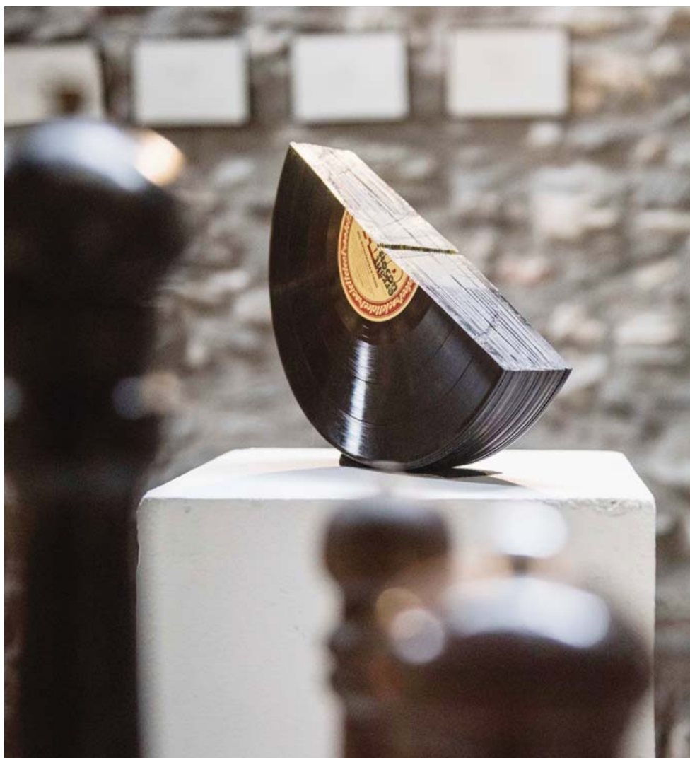
Le Palp Festival (ici l'Exposition universelle de la raclette) mêle modernité et tradition dans le cadre notamment de ses événements Electroclette et Rockclette. Son succès illustre bien le dynamisme de la culture valaisanne.

nées comparables, et ce domaine est inclus dans les statistiques de la culture depuis une douzaine d'années sur les plans suisse et européen.» Et le directeur de l'étude de souligner la part de créativité que recèle l'architecture. Au même titre que les domaines de la presse, de l'informati-