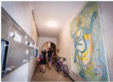
GRAND-PONT Huile sur toile de Vidya Gastaldon installée dans le hall d'un immeuble.