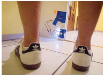
GRAND-PONT «Was bleibt», de Livia Müller, de petites machines qui font vivre un appartement vide.