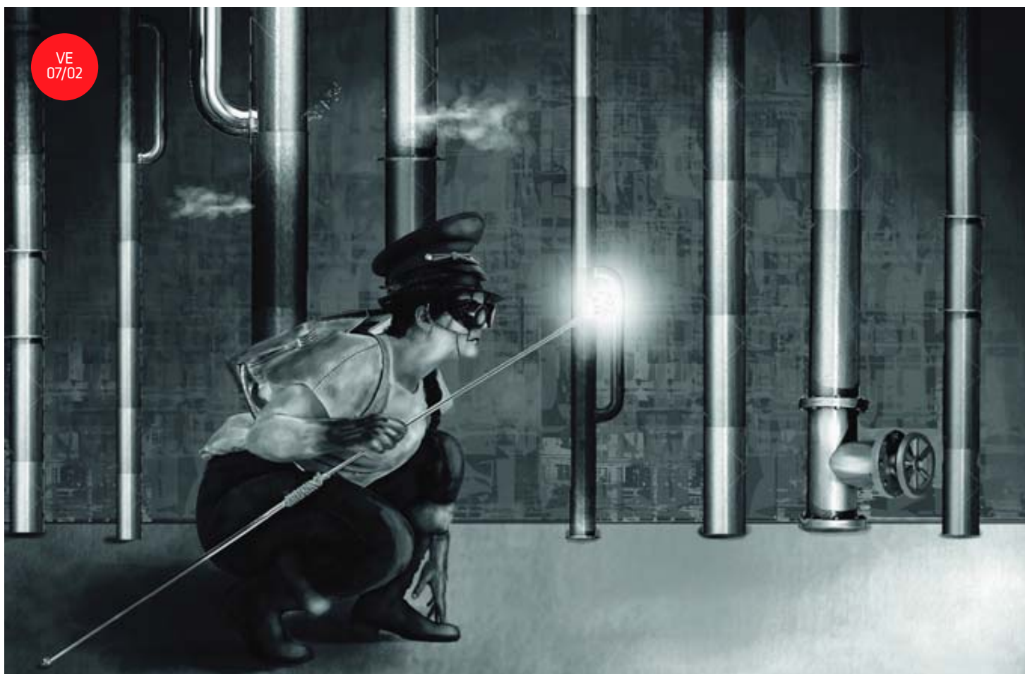
Les œuvres des étudiants de l'EPAC, comme ici dans une classe de deuxième année, seront exposées durant la soirée portes ouvertes.

Vendredi, les visiteurs de l'EPAC auront la possibilité de retourner provisoirement sur les bancs d'école. Un cours de dessins sera proposé aux personnes intéressées. «Le dessin est quand même la base de la plupart des choses enseignées chez