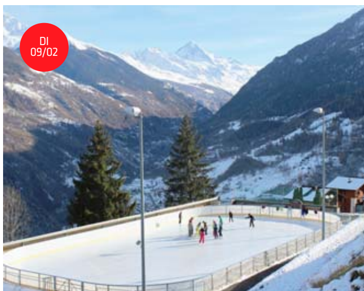
Dimanche, ce sera déjà carnaval à la patinoire d'Hérérence.